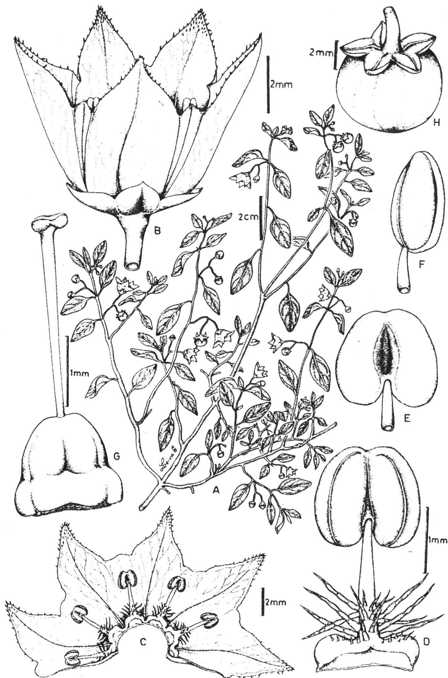
Fig. 2. Jaltomata salpoensis Leiva & Mione: A. Rama florífera; B. Flor en antesis; C. Corola desplegada; D, E, F. Estambre en vista ventral, dorsal y lateral; G. Gineceo; H. Baya. (del. de S. Leiva 1724: HAO).